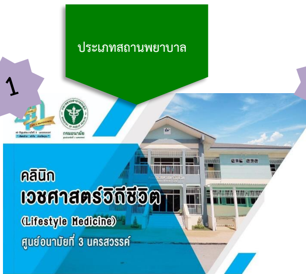
Lifestyle Medicine ศูนย์อนามัยที่ 3 นครสวรรค์