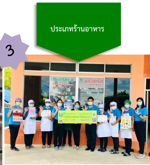
HEALTHY CANTEEN ศูนย์อนามัยที่ 3