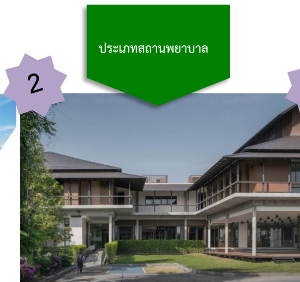
ศูนย์การแพทยมหิดลบำรุงรักษ์