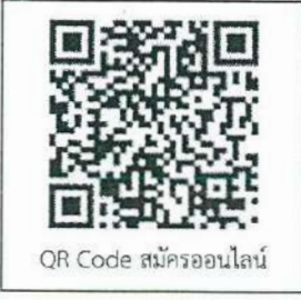
QR Code สมัครออนไลน์

จึงเรียนมาเพื่อโปรดพิจารณาให้บุคลากรในสังกัดเข้ารับการอบรมฯ และเผยแพร่ข้อมูลดังกล่าวให้ทราบ ทั่วกันด้วย จะเป็นพระคุณยิ่ง